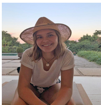
Catarina Herrmann Esportes